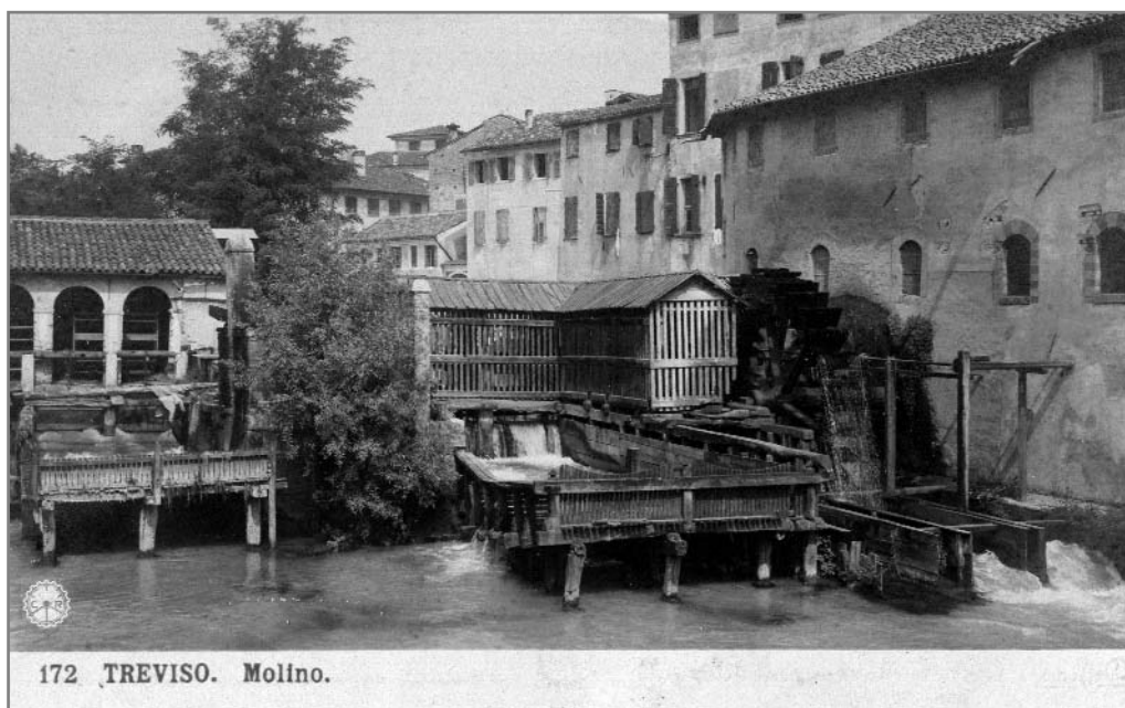
172 TREVISO. Molino.

Continuando una ormai consolidata tradizione, anche quest'anno la Tipografia Sile proporrà il suo calendario dedicato alle vecchie cartoline illustrate della Città realizzato grazie alla collaborazione della Società Iconografica Trivigiana che ha curato il progetto editoriale, la stesura dei testi e la scelta delle immagini. Il tema sarà: TREVISO – I CANALI. Verrà offerto come stenna ai Soci che per primi regolarizzeranno la propria situazione contributiva. Può essere ritirato presso lo Studio Buzzavo al momento del versamento della quota o esibendo la ricevuta di c/c postale.